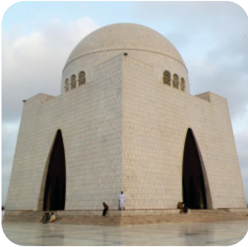
قائدِ اعظمؒ کا مزار

1913ء میں آپ مسلم لیگ میں شامل ہوئے اور بعد میں اس کے صدر بنے۔ اس وقت ہندوستان پر انگریزوں کی حکومت تھی۔ آپ نے مسلمانوں کو جمع کیا اور ان میں اتحاد پیدا کرنے کی بھرپور کوشش کی۔